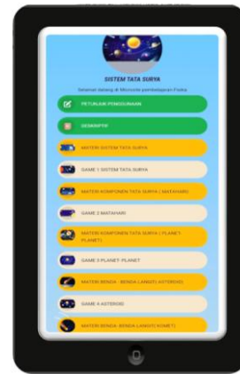
Gambar 2. Tampilan Produk