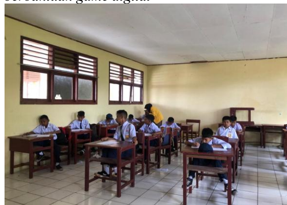
Gambar 3. Implementasi mobile learning berbantuan game digital

Produk yang dihasilkan diimplementasikan dalam pembelajaran pada salah satu SMP di Kota Terante dengan melibatkan siswa kelas VII, berjumlah 18 orang. Angket diberikan setelah peserta didik selesai melakukan proses pembelajaran menggunakan mobile learning berbantuan game digital .